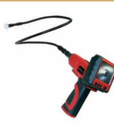
CÁMARAS DE INSPECCIÓN